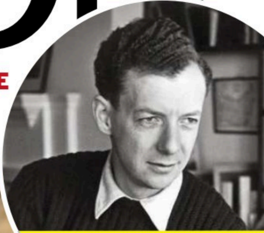
BENJAMIN BRITTEN MAÎTRE DANS UN JARDIN ANGLAIS